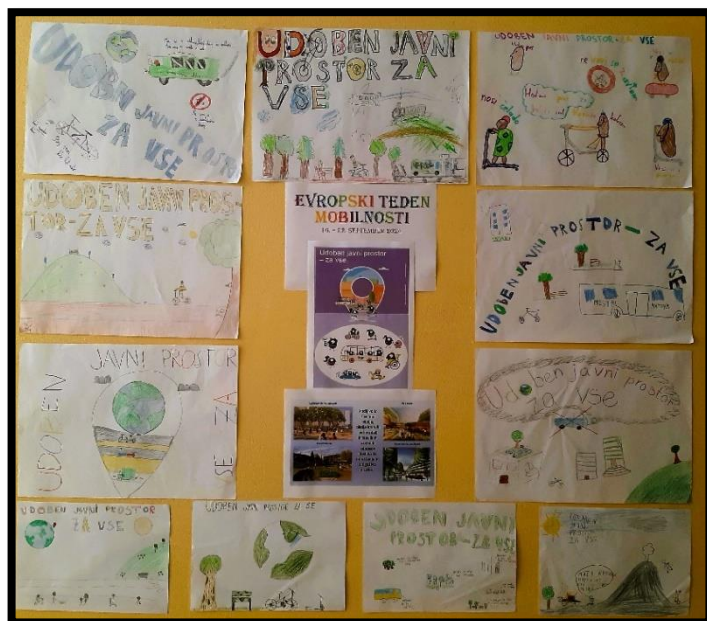
Slika 2: Primeri razstave pred učilnico TIT (učenci 6. razreda)

Učenci so po končanem razgovoru nadaljevali z delom v dvojicah in v obliki plakata predstavili predloge, ideje in zamisli na temo »Javni prostor je za vse«. Učenci so plakate oblikovali v razstavo pred učilnico TIT.