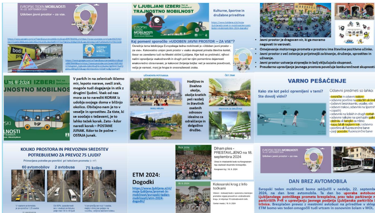
Slika 1: ppt predstavitev za učence TIT 6. r. (V.Stefanovik)

Učenci so po končanem razgovoru nadaljevali z delom v dvojicah in v obliki plakata predstavili predloge, ideje in zamisli na temo »Javni prostor je za vse«. Učenci so plakate oblikovali v razstavo pred učilnico TIT.