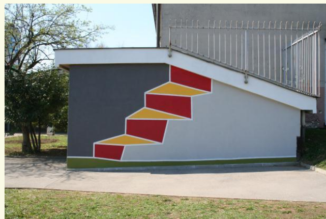
Nekaj študentov Fakultete za arhitekturo in Pedagoške fakultete so z učenci naše šole fasado poslikali.