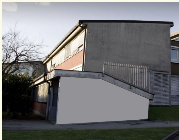
Tudi na računalniško pripravljene fotografiji so nastajale idejne skice